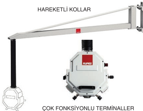
ÇOK FONKSİYONLU TERMİNNALLER