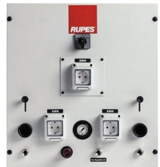
GÖMME MONTAJ İÇİN OTOMATİK FONKSİYONLU TERMİNNALLER